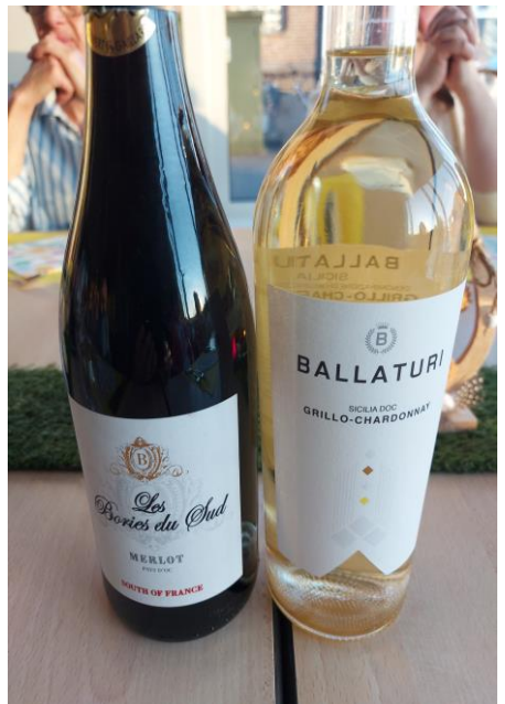
En de nodige drankjes