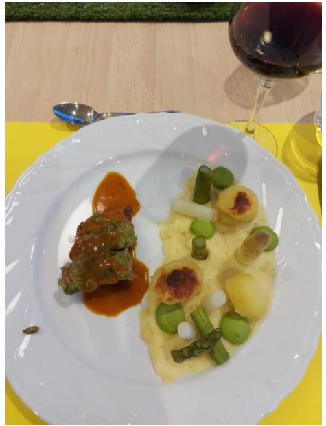
Lamsfile met asperges...