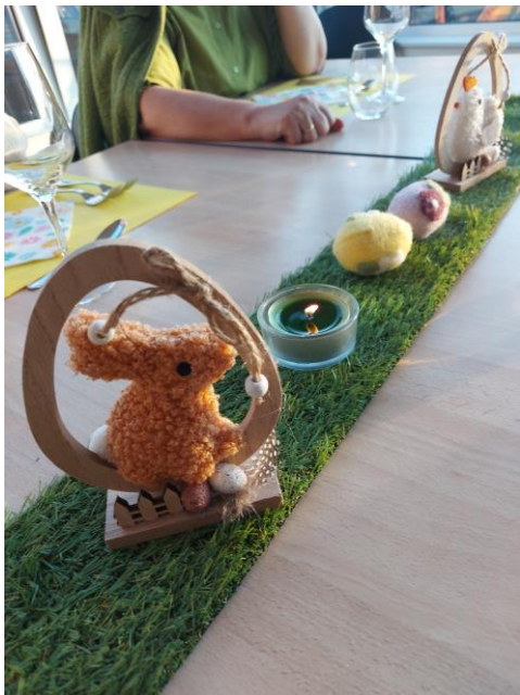
mooië paas tafelversiering