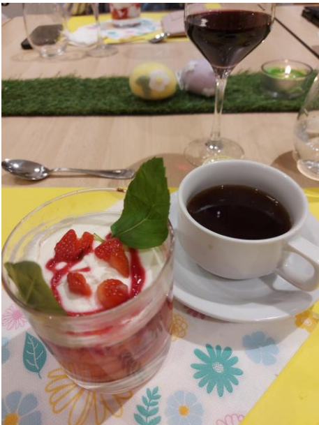
aardbeien met munt en frambozenslagroom !!!