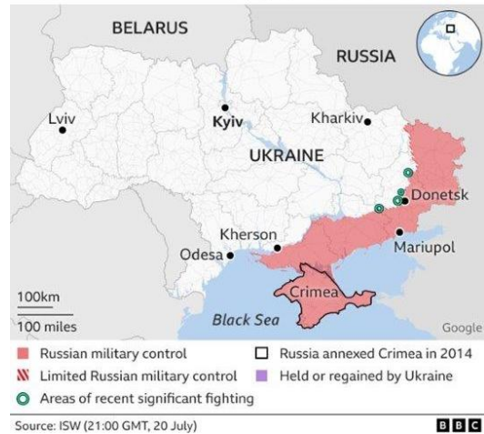
Areas of Russian military control in Ukraine

Met een oppervlakte van 17.098.246 km 2 is Rusland het grootste land ter wereld en is 600 x België. Het heeft 145 miljoen inwoners. Oekraïne is 20 x België maar hiervan is op dit ogenblik één vijfde bezet door Rusland. De Krim is ongeveer zo groot als België. Het grondgebied Oekraïne behoorde in de loop der tijden tot verschillende rijken. Het maakte deel uit van de Oostelijke Slaven die er 1500 jaar voor Christus al aanwezig waren. Het Kievse Rijk, dat gesticht is in de negende eeuw, kan gezien worden als de voorloper van de grote Oekraïense – Russische natie. Aanvankelijk was Kiev de hoofdstad maar in 1240 is dat Moskou geworden. Moskou was toen nog zeer klein, zowel in oppervlakte als in uitstraling. In 1654 hoorde Oekraïne bij Rusland en in 1783 is de Krim bij Rusland gekomen. Bij de industriële revolutie in de Dombas in 1860 werkten er 20.000 Belgen in de Dombas. Tijdens de Russische Revolutie van 1917 was er voor het eerst sprake van een zelfstandig internationaal erkende Oekraïense Volksrepubliek maar de Sovjet-Unie hield het in zijn macht tot het uiteenvallen van de Sovjet- Unie in 1991. Op dat ogenblik konden de 15 afzonderlijke republieken beslissen of ze een afzonderlijke koers wilden varen en allemaal besloten ze om afzonderlijk te gaan. Vanaf dan is Oekraïne een zelfstandig onafhankelijk democratisch land en behoort de Krim tot Oekraïne.